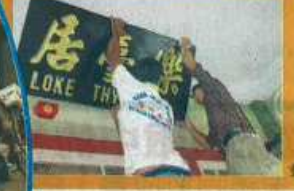
一系台居金字招牌重新上紅船建築的。