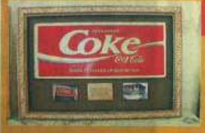
樂台居保留良好的可口可樂廣告牌。